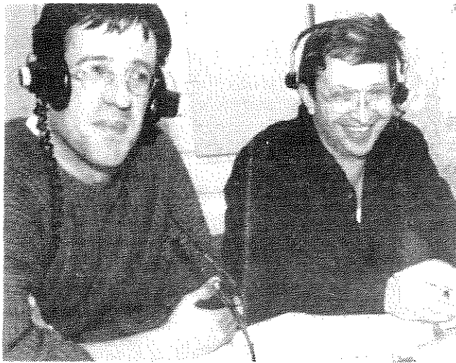
קול ישראל וגלי צה"ל בקול אחד במלחמת המפרץ

הנה כי כן, התקשורת הישראלית בשנות ה-90 מגוונת יותר מזו בשנות ה-50, חוקרת יותר, חשדנית יותר כלפי הממסד הפוליטי אך עדיין אין בה כדי לשמש נציגת האזרחים כלפי מנגנוני השלטון.